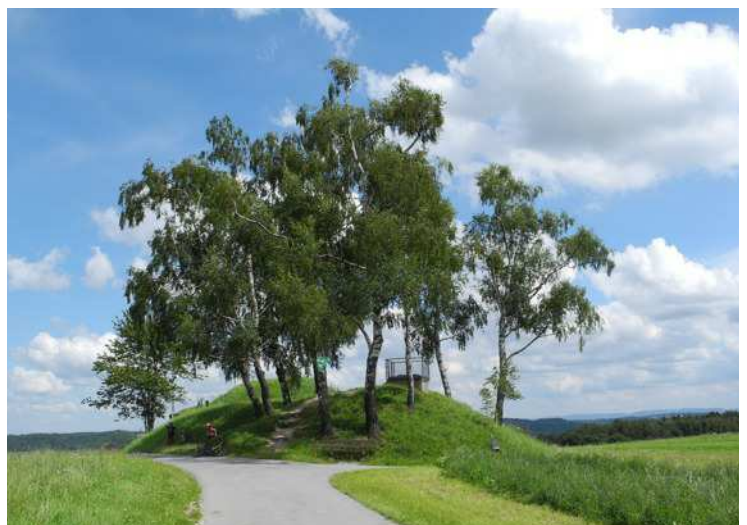
rechts: die „Haube“ mit 536 m üNN die angeblich höchste Erhebung im Rems - Murr Kreis*