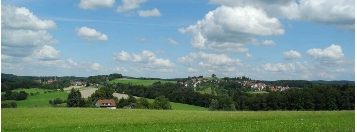
oben: Blick zurück von Kallenberg nach Lutzenberg, Mannenberg und auf die „Haube“