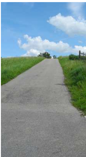
links: Aufstieg auf die „Haube“ mit 18% Steigung